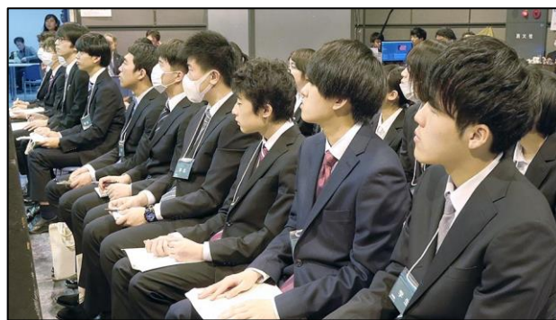
熱心に聞き入る学生さん