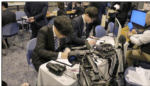
音声収録や編集MAなどの出展もありました