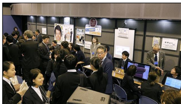
個別説明ブースも、質問する学生さんで溢れていました