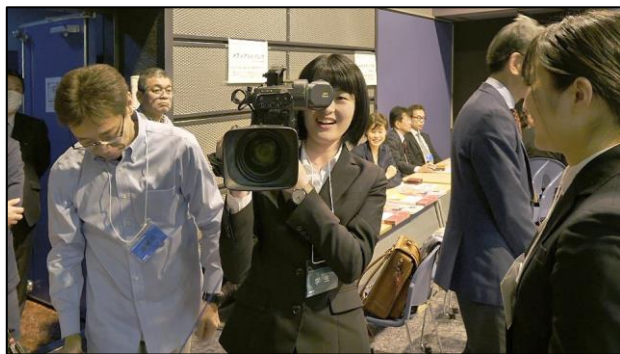
実際にプロフェッショナル機器に触れてもらいました