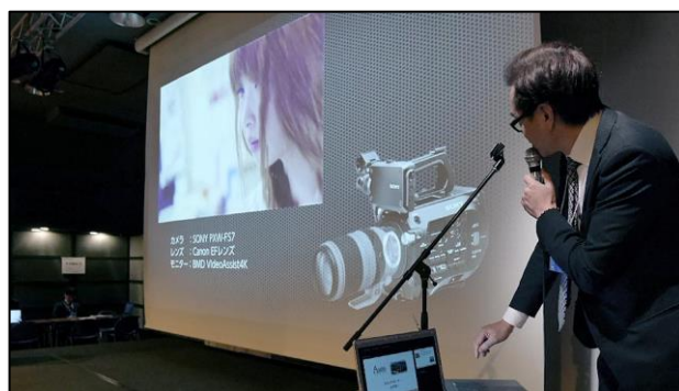
実際の撮影現場映像を使った分かりやすいセミナー