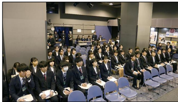
約100名収容の会場に大勢の学生が集まりました